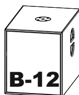
Livemusik und Touring