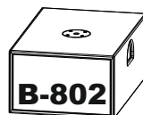
Touring und Installation